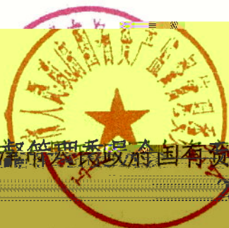
天津市人民政府国有资产监督管理委员会